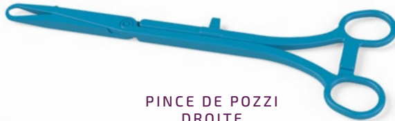
PINCE DE POZZI DROITE