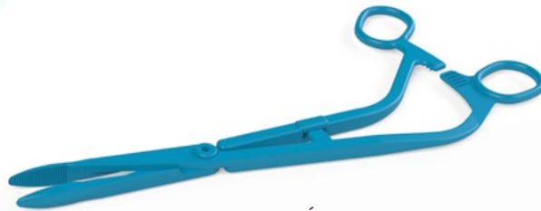
PINCE DE CHÉRON