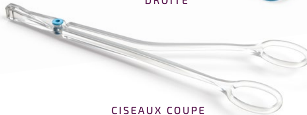
CISEAUX COUPE FIL DISTAL